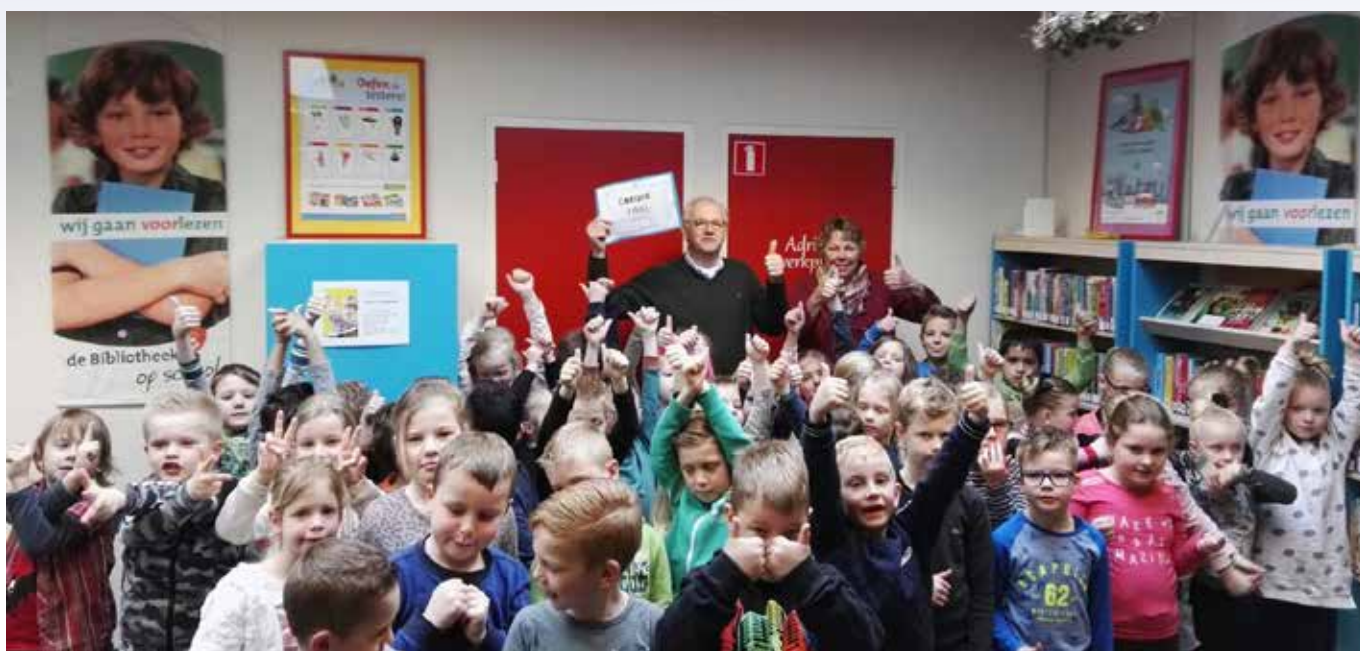
Kerstactie Coligny- en Farélschool