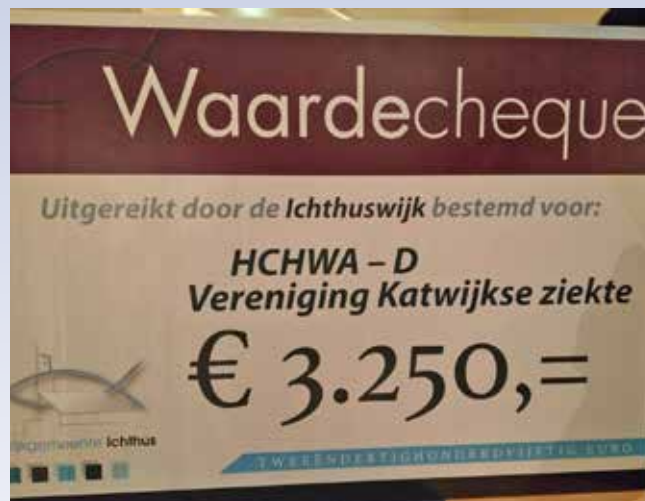
Gift wijkgemeente Ichthus