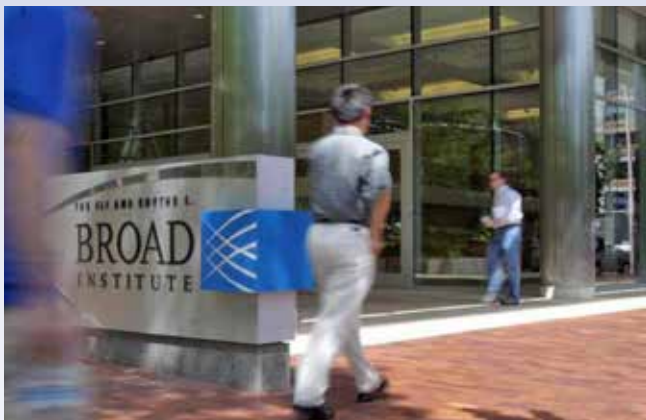
Broad Institute MIT and Harvard, Boston

5th International CAA Conference 2016, Boston MA September 8 @ 8:00 am - September 10 @ 12:00 am